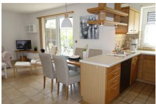
ein Teil der Küche, Essplatz und im Hintergrund das TV Gerät