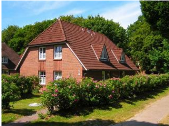
Das Haus Godewind im Eulenkamp/Ecke Gmelinstrasse