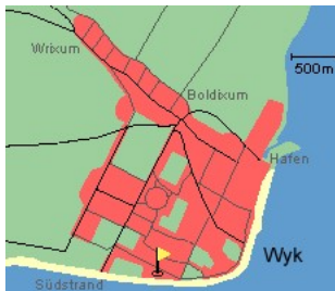
Entfernungen, zirka: zum Bäcker 50 m, zur Einkaufsmöglichkeit 400 m, zum Flugplatz 1,5 km, zum Golfplatz 1,5 km, zum Hafen 2,0 km, zum Meer 50 m, zum ÖPNV 50 m, zum Badestrand 50 m, zum Ortszentrum 1,0 km