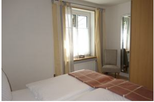
....und Fenster sowie großem Kleiderschrank