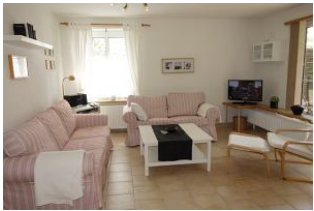
Zwei gemütliche Couchen für den TV Abend, oder zum lesen, oder einfach nur zum "langmachen"