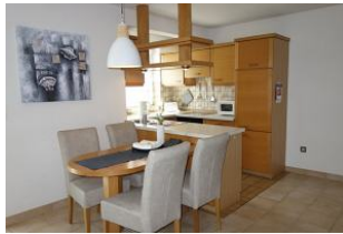
Der Essplatz, im Hintergrund die offene Küche