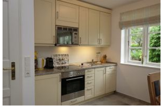
...die offene Küchenzeile