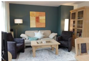
Harmonische Farben, gemütliche Couch und Sessel...