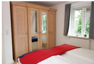
Der große Kleiderschrank bietet genügend Platz für die Kofferinhalte