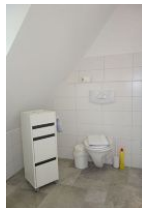
...und die Toilette