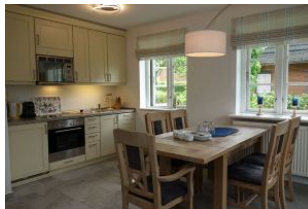
...der großzügige Esstisch...nehmen Sie Platz.