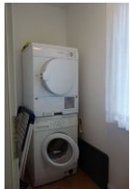
Im Hauswirtschaftsraum zur kostenfreien Nutzung; Waschmaschine und Trockner.