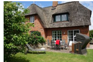
Die Terrasse mit Tisch und Stühlen, Liege, Strandkorb und.....viel Sonnenschein