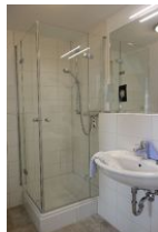
Das Duschbad im Obergeschoß, vom Elternschlafzimmer aus zu begehen.