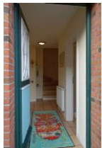
Treten Sie ein und fühlen sich einfach wohl....

...wer mag nicht gern beim aufwachen den Geruch von frisch gebackenen Brötchen riechen ??? Sie müssen die Backwaren noch selbst holen, aber es sind nur ein paar Schritte bis zum Bäcker Hansen Das Haus Kastanie bietet eine moderne Doppelhaushälfte für 4 Personen + Baby (im Notfall gibt es auch noch zwei weitere Schlafplätze) Eine voll eingerichtete Küche, Wohnzimmer mit großzügigem Essplatz, 2 Duschbädern und zwei Schlafzimmern ! Hier findet die ganze Familie Platz. Und Ihre Fellnase darf auch mit. Kommen Sie, schauen Sie...und fühlen Sie sich einfach wohl !