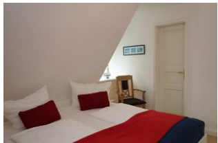
Das Elternschlafzimmer mit 2 Fenstern, eins mit Fliegengitter versehen. Die Tür führt ins Bad.