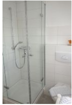
Die Dusche im Erdgeschoß