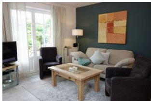
...vorn links im Bild, das TV -Gerät