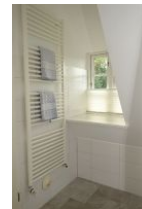
Auch hier die Handtuchheizung