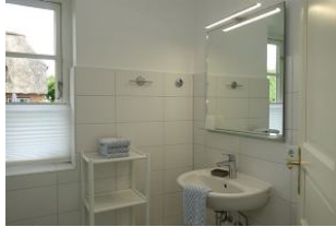
Das Bad im Erdgeschoß...Handwaschbecken, Ablagemöglichkeiten.....