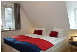
...und das zweite Fenster.