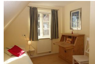
...wer gar nicht ohne Schularbeiten auskommt, darf hier Platz nehmen... Das Fenster ist auch mit einem Fliegengitter ausgestattet.