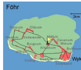
Entfernungen, zirka: zum Bäcker 150 m, zur Einkaufsmöglichkeit 2,5 km, zum Flugplatz 4,0 km, zum Golfplatz 4,2 km, zum Hafen 4,5 km, zum Meer 4,0 km, zum ÖPNV 200 m, zum Badestrand 4,0 km, zum Ortszentrum 200 m