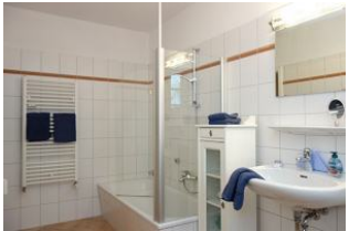
Das Bad mit Badewanne (+Duschkmöglichkeit)