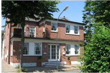
Das Haus Hallig Hooge in der Friedrichstrasse in Wyk