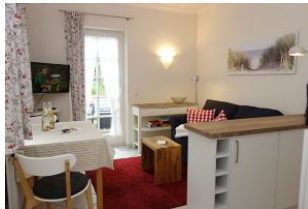
Der Blick ins Wohnzimmer