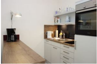
...hier noch einmal die Küchenzeile.