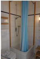
Noch einmal die Dusche mit hoher Wanne !