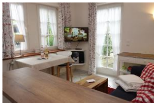
Esstisch und TV Gerät