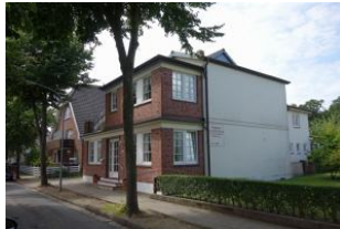
Das Haus Hallig Hooge von der Seite, früher war das Haus eine Pension