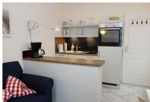
Die neue Küche mit Backofen und Geschirrspüler..