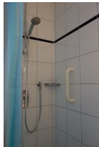
Die Dusche mit Haltegriff.