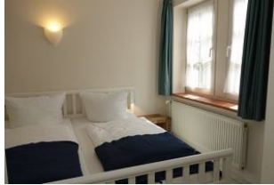
Das Doppelbett und ein großes Fenster