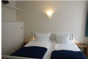
Das Doppelbett 190x200cm und der Einbauschränk.