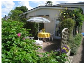
Die herrliche Terrasse. Zugang vom Wohnzimmer aus.

Ruhig gelegen, inmitten unseres kleinen Städtchens Wyk finden Sie unser Haus Hallig Hooge, welches insgesamt 7 Wohnungen für 2 Personen beherbergt.. Das Appartement Oland ist ein gemütliches Feriendomizil, in dem Sie alles finden "was man so braucht" Hier, abseits von Hektik und Stress werden Sie schnell den Alltag vergessen. Lassen Sie die Seele baumeln, atmen Sie tief durch und genießen Sie die Föhler Luft. Das Haus Hallig Hooge liegt so zentral, daß auch Ihr Auto Urlaub machen kann.