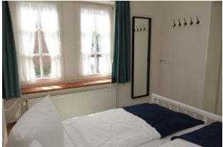
Im Schlafzimmer ein großer Spiegel