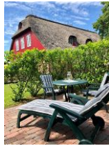
Im großen Garten ein kleines Plätzchen nur für die Wohnung 5 mit Liege und...