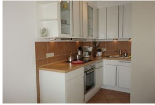
Die offene Küche beinhaltet alles, "was man so braucht"