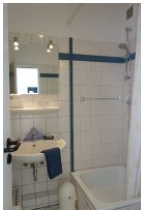
Das Duschbad, nicht im Bild die Toilette