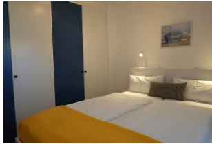
Genügend Stauraum für Kofferinhalte