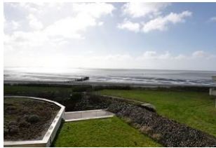
...dieser Aussicht gibt es nichts mehr hinzuzufügen....