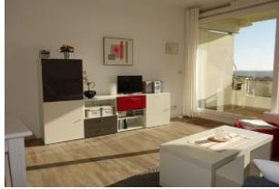
Sideboard mit TV, rechts der Austritt auf den Balkon