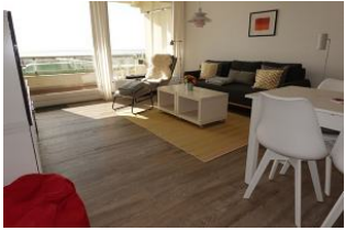
Das Wohnzimmer im Gänze