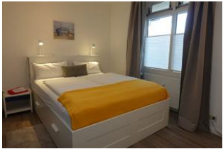
Das Doppelbett misst 180x200cm, kein Fußteil