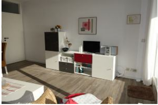
Sideboard mit TV, links im Hintergrund die Tür zum Flur.