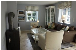
Blick ins Wohnzimmer mit gemütlicher Couchecke und Sessel.

Entfernungen, zirka: zum Bäcker 400 m, zur Einkaufsmöglichkeit 400 m, zum Flugplatz 2,5 km, zum Golfplatz 2,5 km, zum Hafen 5,0 km, zum Meer 1,0 km, zum ÖPNV 500 m, zum Badestrand 1,0 km, zum Ortszentrum 200 m