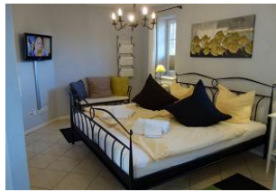
Großes Schlafzimmer im Erdgeschoß mit Doppelbett und zus. TV-Gerät