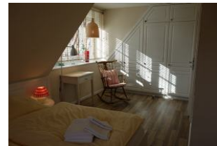
.....mit einem Schaukelstuhl zum "sich zurück ziehen" zu lesen, zu träumen, oder .....

Ein herrlich großer Garten für Sie allein (ca. 800qm)