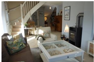
...hier von der anderen Seite zu sehen.