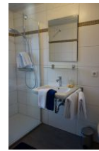
Das kleine Duschbad im Erdgeschoß