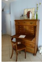
Ein ruhiges Plätzchen für die Urlaubspost.