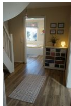
Der Flur im Obergeschoß