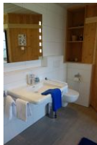
Das große Bad im Erdgeschoß mit Handwaschbecken...