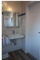
Das kleine Bad im OG mit Handwaschbecken und ...