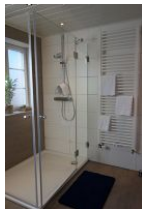
... geräumiger Dusche ....