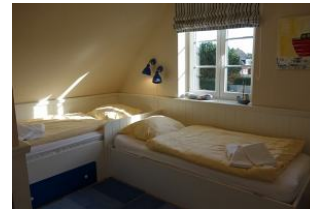
Das Kinderzimmer im Obergeschoß