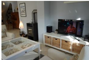
...Kaminofen und TV-Gerät