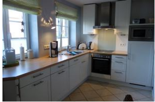
Die Küchenzeile hat "Alles was man so braucht"