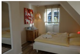
Das Doppelschlafzimmer im Obergeschoß