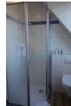
.....Dusche und Toilette.