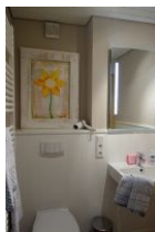
Das neu gestaltete Bad mit viel Ablagefläche und ....