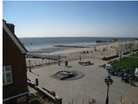
...herrlich, die Mittelbrücke und der Gezeitenbrunnen