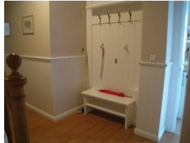
Die Garderobe mit Sitzbank und Schuhregal im Flur - nur für Sie.