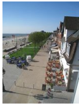
Der Blick auf den neu gestalteten Sandwall

In diesem, fast 100 Jahre alten Stadthaus wohnt man wirklich "mittendrin". Auf der geschlossenen Veranda, die Wind und Wetter abhält, den Blick auf die Promenade aber freigibt, könnte man den ganzen Tag verbringen. Den Menschen zusehen, entfernt die "Kurmusik" hören, aufs Meer schauen - eben einfach die Seele baumeln lassen. Das ist Erholung pur. Die modern eingerichtete Wohnung mit dem Charme alter Gemäuer liegt im 2.OG des Hauses und bietet 2 Personen ausreichend Platz für einen erholsamen Urlaub. Aber Achtung: dies alte Haus hat auch alte Treppen. Lang, steil und kurze Stufen. Allein vom Hauseingang in die 1.Etage müssen Sie 17 Stufen bewältigen.