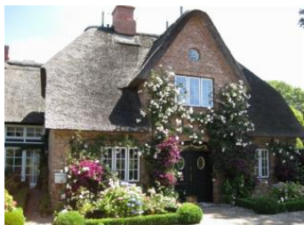
Reethus 5, ein Hausteil mit Stil.

Die Unterkunft verteilt sich über EG und 1.OG.