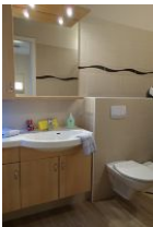
Das Badezimmer mit einem Waschtisch, der viel Platz bietet.....