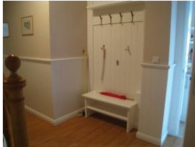
Die Garderobe mit Sitzbank und Schuhregal im Flur - nur für Sie.