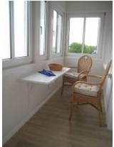
Auf der Loggia können Sie beim Frühstück den Blick auf das Meer genießen.