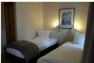
..hier noch einmal die Betten, die auch mühelos zusammen gestellt werden können.

Entfernungen, zirka: zum Bäcker 30 m, zur Einkaufsmöglichkeit 350 m, zum Flugplatz 3,0 km, zum Golfplatz 3,0 km, zum Hafen 600 m, zum Meer 50 m, zum Badstrand 50 m, zum Ortszentrum 50 m