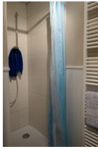
... geräumiger Dusche (flacher Einstieg).