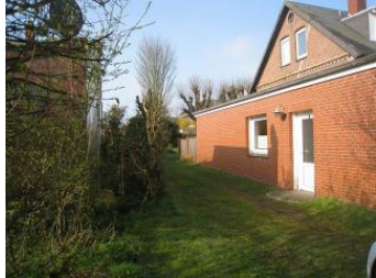
Die Eingangstür der Wohnung 5 der Ferienhäuser Carstensen