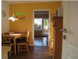
Ein Blick in die Küche mit Essplatz. Im Hintergrund das Wohnzimmer.