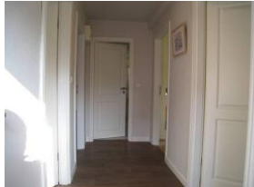
Der Eingangsbereich, treten Sie ein....

Auf einem ca. 3000qm großen Grundstück zwischen Boldixumer Str. und Umgehungsstrasse können wir Ihnen 4 Ferienwohnungen für 2 - 5 Personen anbieten. Die Wohnung 5 ist für 5 Personen eingerichtet und verfügt über 3 Schlafzimmer, 1 Duschbad, offene Küche mit Essplatz, Wohnzimmer mit Austritt auf die Terrasse. Herrlich - mitten in der Stadt zu wohnen. Vor hier aus, können Sie alle Wege in Wyk zu Fuß erledigen, Bäcker und Einkaufsladen befinden sich fast ggüb. dem Haus.