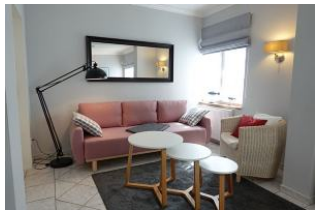
Lange Couch, gemütlicher Sessel und Licht zum lesen !