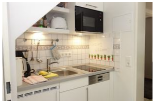
Die kleine Küchenzeile mit Geschirrspüler und Mikrowelle

Ruhig gelegen, inmitten unseres kleinen Städtchens Wyk finden Sie unser Haus Hallig Hooge, welches insgesamt 7 Wohnungen für jeweils zwei Personen beherbergt. Das Appartement Langeneß ist größer als die anderen Erdgeschossappartements und bietet daher ein wenig mehr Freiraum. In dem großzügigen Wohnraum mit Essplatz, der kleinen Einbauküche, dem Schlafzimmer mit Einzelbetten, und dem Duschbad kann man auch einen längeren Aufenthalt geniessen, ohne sich eingeeengt zu fühlen. Ein großer Kleiderschrank im Flur vor dem Schlafzimmer bietet genügend Platz für Garderobe.