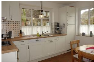
...Waschmaschine, befindet sich im Schrank neben dem Kühlschrank