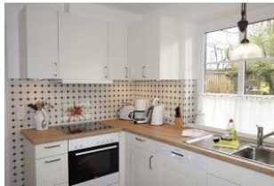
Die helle Küche mit großzügiger Küchenzeile. Geschirrspüler, Backofen und ...