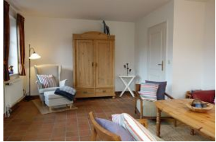
Die Lesecke und ein alter Bauerschrank für düd un dat.