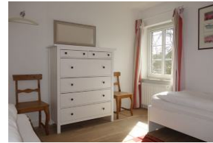
Kommode im Kinderzimmer