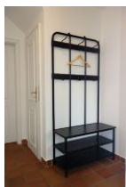
Die Garderobe im Flur.

Hier stellen wir Ihnen die linke Doppelhaushälfte des Hauses Adebar in Oevenum vor. Geschmackvoll eingerichtet bietet sie 4 Pers. ausreichend Platz für einen erholsamen Urlaub. Für Besuch stehen zwei weitere Schlafplätze zur Verfügung. Im Erdgeschoss befinden sich Wohn/Ess- und Küchenbereich sowie das Gäste - WC. Im Obergeschoss 2 Schlafzimmer sowie das große Bad mit Dusche und Badewanne. Genießen Sie die Ruhe des kleinen Inseldorfes Oevenum mit 600 Einwohnern, einem Bäcker, einem Einkaufsladen sowie dem Dorfkug der hervorragende Hausmannskost anbietet.