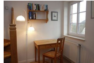
Ein kleiner Schreibplatz im Flur im OG für die ganz Fleißigen