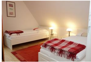
Zwei Einzelbetten im Kinderzimmer