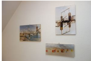
Bilder im Flur im OG