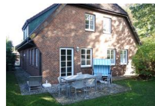
Die Terrasse im Herbst - etwas verwaist