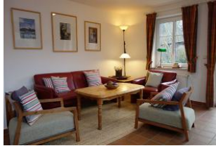
Couch und Sessel aus der Nähe.