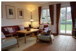
Das großzügige Wohnzimmer.