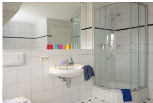
Das Duschbad im Obergeschoß