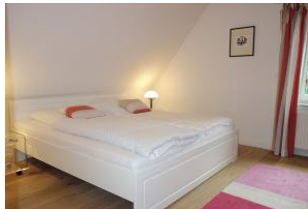
Grosses Bett im Elternschlafzimmer 180x200cm ohne Fussteil