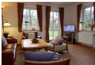
Das TV Gerät, Austritt auf die Terrasse