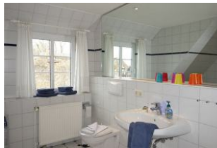
...mit großem Fenster ...