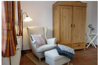
Hier noch einmal der Sessel, sooo gemütlich!