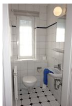
Das Gäste - WC im Erdgeschoss