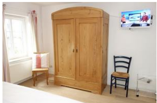
Viel Platz für Kofferinhalte und zweites TV Gerät