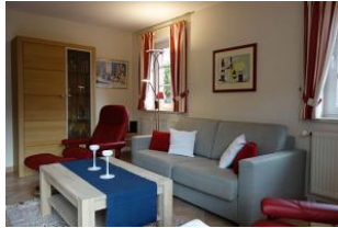
Couch und toller Stressless Sessel mit Fusshocker