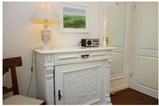
Kommode im Schlafzimmer