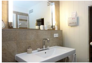
Das Bad im Untergeschoß, rechts die Tür führt in die Sauna.