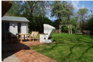
Die Terrasse hinter dem Haus mit dem Garten - nur für Sie zu nutzen. Der Austritt auf die Terrasse befindet sich im Essbereich