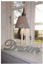
I had a dream.....