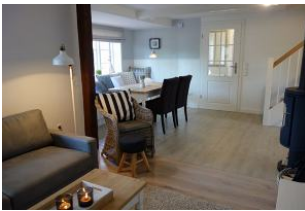
Blick vom Wohnzimmer zum Eingangsbereich