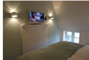
... ebenfalls mit Flachbild - TV - Gerät