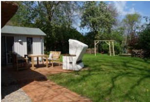
Die Terrasse hinter dem Haus mit dem Garten - nur für Sie zu nutzen. Der Austritt auf die Terrasse befindet sich im Essbereich