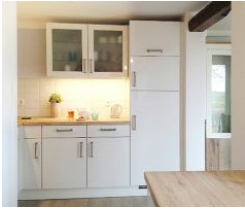
...und der andere Teil für Geschirr etc.