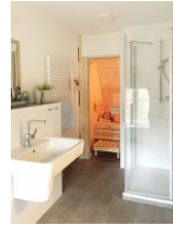
... und Duschkabine. Die Sauna steht Ihnen kostenfrei zur Verfügung !