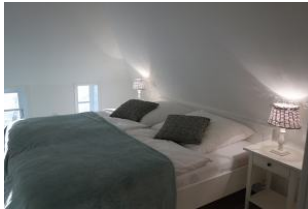
Das Doppelschlafzimmer (Bettmaaß 180x200cm) im Obergeschoß...