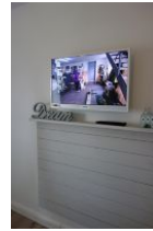
...Flachbild - TV - Gerät