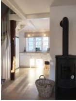
Der Blick vom Wohnzimmer zur Küche, vorbei am dänischen Ofen.