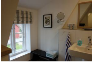
Das Bad im OG mit Handwaschbecken....