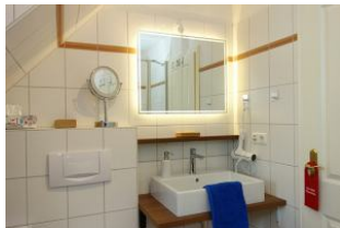
Das Duschbad mit Handwaschbecken. (nicht im Bild die Toilette)