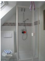
... Toilette und Duschkabine mit Echtglas