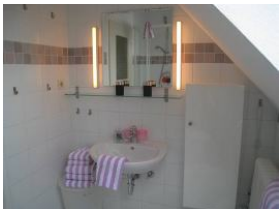
Das Badezimmer mit Waschbecken, Spiegel....