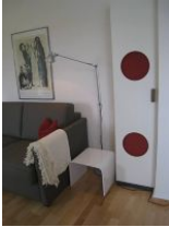
Gediegen, ein auffälliger Schrank im Wohnzimmer....