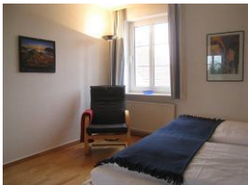
Ein gemütlicher Sessel zum schmökern...