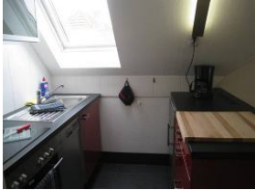
Die neue Einbauküche