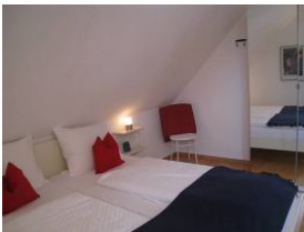
Doppelbett, im Hintergrund der Kleiderschrank mit großem Spiegel