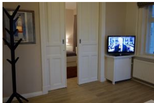
Modernes TV - Flachbild - Gerät Hinter der Schiebetür verbirgt sich...