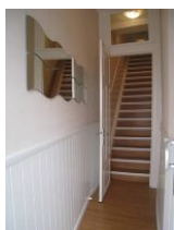
Der schmale Eingang mit Treppe nach oben. 17 Stufen, steil und kurz - Fitness pur

Die ca. 65qm große Wohnung in der 1.Etage des Hauses Promenadenblick bietet ein rundum-Wohlfühlpaket. Esszimmer mit offener Küchenzeile, Wohnzimmer mit gemütlicher Couch und Sessel, sep. Schlafzimmer mit großem Doppelbett. Dazu die Veranda, die den Blick auf das bunte Treiben auf der Promenade, sowie den Strand und das Meer frei gibt. Ein modernes Bad mit großräumiger Dusche. Hier paart sich der Charme eines alten Hauses mit moderner Einrichtung - sehr gelungen. Aber Achtung, allein die alte, lange Treppe in die 1.Etage hat 17 steile, kurze Stufen, die es zu bewältigen gilt.