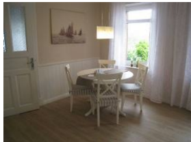
... ein wunderbarer Essplatz mit rundem Tisch...