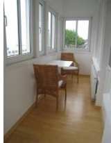
... und ein abklappbarer Tisch mit gemütlichen Korbesseln.