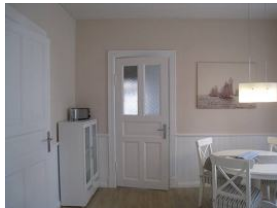
Der Blick von der Küche Richtung Wohnzimmer.