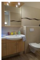
Das Badezimmer mit einem Waschtisch, der viel Platz bietet....