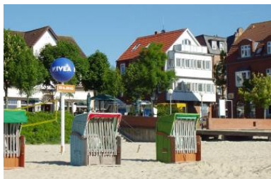
Unser Haus "Promenadenblick" in der Mittelstr. 2 / Ecke Sandwall