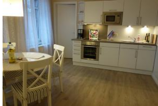
Die Küchenzeile mit Backofen und Mikrowelle...