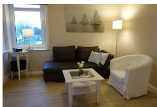
Der Wohnraum mit gemütlicher Couch und Sessel...