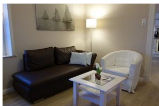
hier noch einmal etwas näher...