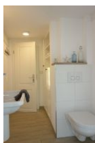
...Toilette und Einbauschränk