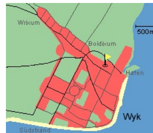
Entfernungen, zirka: zum Bäcker 50 m, zur Einkaufsmöglichkeit 50 m, zum Flugplatz 3,0 km, zum Golfplatz 3,1 km, zum Hafen 500 m, zum Meer 350 m, zum ÖPNV 70 m, zum Badestrand 350 m, zum Ortszentrum 100 m