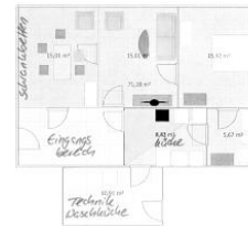
Grundriss der Wohnung 1 im EG der Villa Hansson