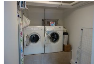
...Waschmaschine und Trockner, kostenfrei zu nutzen. Bitte Zwischentür abschließen, die Gäste aus dem Obergeschoß dürfen die Maschinen auch nutzen.