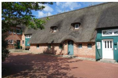
Der Herrenhof im Winter. Der mittlere Eingang führt in die Wohnung 8