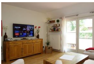
Das neue TV Gerät. SmartTV mit Netflix und Amazon.