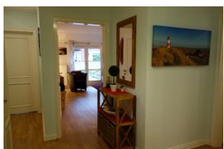
Sie befinden sich im Flur der Whg. 8 auf dem Herrenhof.