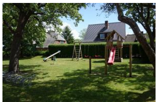
Der Spielplatz auf dem Gelände

Auf dem riesigen Areal des Herrenhofes in Wrixum, der 9 Ferienwohnungen beherbergt, bieten wir Ihnen die Erdgeschoßwohnung No. 8 an. Auf 85 qm finden Sie großzügig aufgeteilt, das Wohnzimmer mit Essplatz, die sep. Küche mit Essplatz, 2 Schlafzimmer und das Duschbad. Ein kleiner Abstellraum mit Waschmaschine und Trockner. Zusätzlich eine herrliche Terrasse, die vom Wohnzimmer aus zu begehen ist. Zur Allgemeinnutzung gibt es einen Spielplatz für die Kinder