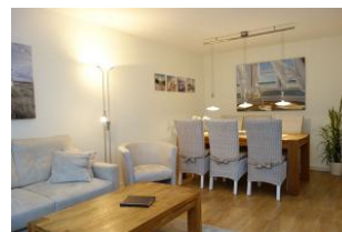
Der großzügige Esstisch im Wohnzimmer