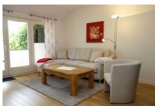
Der Blick in das großzügige Wohnzimmer...