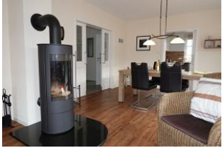
Der Ofen, im Hintergrund der große Esstisch und Durchgang zur Küche