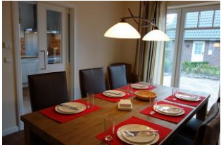
Der große Esstisch - im Hintergrund, die Küche. Rechts die Terrassentür