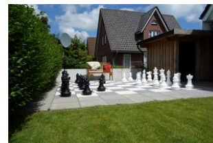
Das versprochene Schachbrett im Garten zum Spielen für die ganze Familie