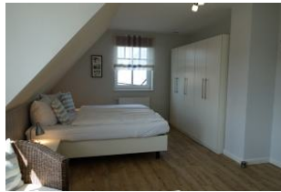
Viel Schrankraum .....