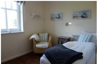
Ein Schlafzimmer im Erdgeschoß mit Einzelbett, Kleiderschrank. Nicht im Bild, das TV - Gerät.