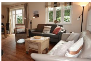
Zwei Sofas garantieren einen gemütlichen Abend

Dieses Einzelhaus in der Flurstrasse in Wyk, läßt Urlaubsherzen höher schlagen. Herrlich für Familien. Vier Schlafzimmer geben jedem Familienmitglied eine Rückzugsmöglichkeit. Der gemeinsame Wohn- Essraum mit halb offener Küche dient der Kommunikation. Zwei Bäder lassen auch am Morgen nicht das Frühstück in unendliche Ferne rücken. Das Fensteröffnen zum lüften ist nicht nötig, das Haus verfügt über eine zentrale Lüftungsanlage, die einen hohen Komfort der Raumluft garantiert. Hier wurde an Alles gedacht, seien Sie gespannt. Ach übrigens, sind Sie vielleicht Schachspieler ? Im Garten befindet sich ein 4x4 m großes Schachfeld aus Steinplatten, den Schlüssel zum Schrank für die großen Figuren bekommen Sie bei uns !