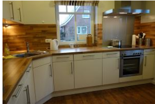
Die sep. Küche hat alles "was man so braucht"