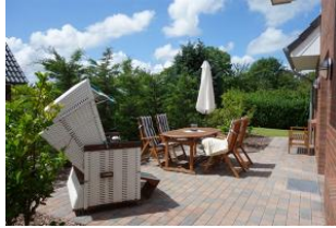
Die herrlich eingewachsene Terrasse. Die Terrassentür befindet sich am Essplatz.