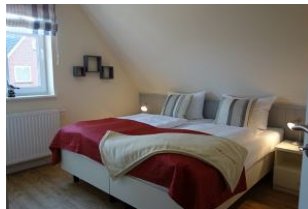
Ein weiteres Schlafzimmer im OG mit zwei Einzelbetten und Kleiderschrank.