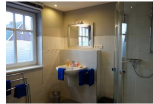
Das Duschbad im Obergeschoß mit .....