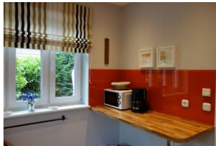
...und eine sep. Arbeitsfläche