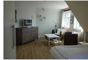
... herrlich groß, mit gemütlichen Sesseln für die Lesestunde, oder einen Film anzusehen.