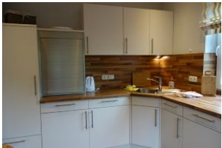
Ein Teil der Küchenzeile...