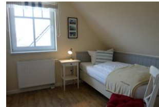
Ein Schlafzimmer im OG mit Einzelbett, auch hier großer Kleiderschrank und TV - Gerät. (nicht im Bild)