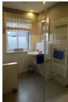
Das Duschbad im EG, hier befindet sich auch die Waschmaschine, die Ihnen kostenfrei zur Verfügung steht.