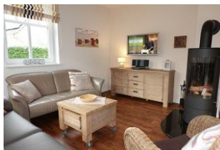
Das TV Gerät und Ofen