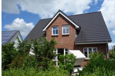
Das Haus Flurstrasse 28

Die Unterkunft verteilt sich über EG und 1.OG.