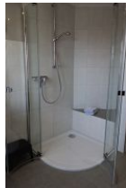
....großer Duschkabine und einer Sitzbank für Kinder