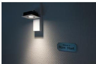
Die Wohnung 3 - Rüm Hart lädt ein .....