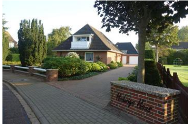
Hedwigs Haus in der Flurstr. 5 Die Ferienwohnung befindet sich im 1.OG