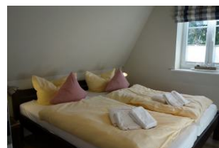
Das Doppelbett im Schlafzimmer mit ...