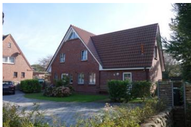
Die Unterkunft befindet sich im 1.OG.