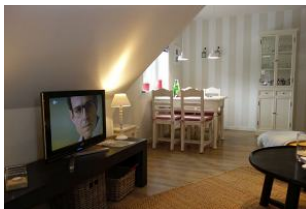
Ein Essplatz am Fenster, hier läßt sich auch wunderbar Urlaubspost erledigen.