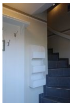
...herein spaziert ....

In unserem neuen Haus Eltimjo befindet sich eine "schnuckelige" Ferienwohnung für 2 Personen. Wohnzimmer, Schlafzimmer, offene Küchenzeile und Duschbad. Herrlich gemütlich im Dachgeschoß. Freisitz mit Strandkorb und Möbeln. Diese Wohnung - gemeinsam gemietet mit dem Haus Eltimjo - eignet sich besonders für Familien. Hier kann man sich ein wenig zurückziehen, wenn es im Haus zu "trubelig" wird.