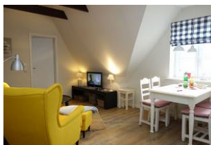
...die mediale Elektronik darf natürlich auch nicht fehlen. Rechts im Bild der Esstisch