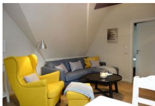
..gemütlich und farbenfroh - die Sitzecke