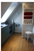
...und der andere Teil.