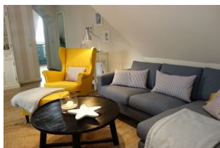
Große Couch und Sessel