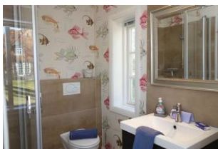
Das Duschbad im Erdgeschoß