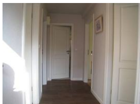
Der Eingangsbereich, treten Sie ein....

Auf einem ca. 3000qm großen Grundstück zwischen Boldixumer Str. und Umgehungsstrasse können wir Ihnen 4 Ferienwohnungen für 2 - 5 Personen anbieten. Die Wohnung 5 ist für 5 Personen eingerichtet und verfügt über 3 Schlafzimmer, 1 Duschbad, offene Küche mit Essplatz, Wohnzimmer mit Austritt auf die Terrasse Herrlich - mitten in der Stadt zu wohnen. Vor hier aus, können Sie alle Wege in Wyk zu Fuß erledigen, Bäcker und Einkaufsladen befinden sich fast ggüb. dem Haus.