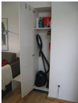
... der Staubsauger etc. bereit hält.