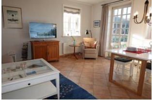
Der Blick ins Wohnzimmer, die Leseecke