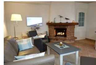
Couch und zwei Sessel. Kamin und TV Gerät. Es wird Ihnen an nichts fehlen für einen gemütlichen Abend