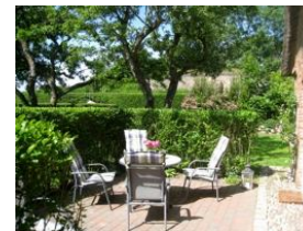
...hier läßt es sich aushalten....