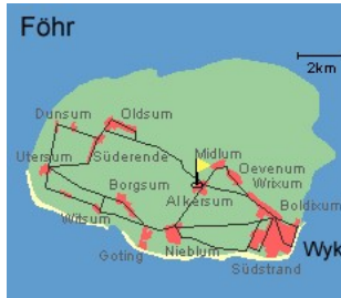
Entfernungen, zirka: zum Bäcker 150 m, zur Einkaufsmöglichkeit 2,5 km, zum Flugplatz 4,0 km, zum Golfplatz 4,2 km, zum Hafen 4,5 km, zum Meer 4,0 km, zum ÖPNV 200 m, zum Badestrand 4,0 km, zum Ortszentrum 200 m