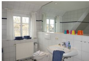
...mit großem Fenster ...