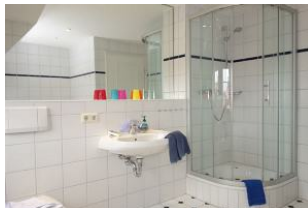
Das Duschbad im Obergeschoß