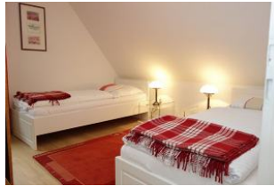
Zwei Einzelbetten im Kinderzimmer