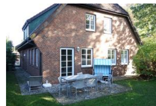
Die Terrasse im Herbst - etwas verwaist