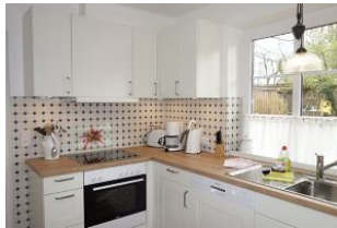
Die helle Küche mit großzügiger Küchenzeile. Geschirrspüler, Backofen und ...