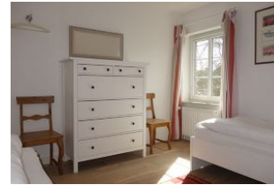
Kommode im Kinderzimmer