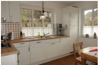
...Waschmaschine, befindet sich im Schrank neben dem Kühlschrank