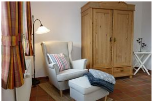
Hier noch einmal der Sessel, sooo gemütlich!