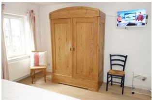
Viel Platz für Kofferinhalte und zweites TV Gerät