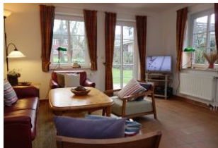
Das TV Gerät, Austritt auf die Terrasse