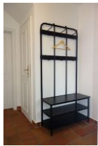
Die Garderobe im Flur.

Hier stellen wir Ihnen die linke Doppelhaushälfte des Hauses Adebar in Oevenum vor. Geschmackvoll eingerichtet bietet sie 4 Pers. ausreichend Platz für einen erholsamen Urlaub. Für Besuch stehen zwei weitere Schlafplätze zur Verfügung. Im Erdgeschoss befinden sich Wohn/Ess- und Küchenbereich sowie das Gäste - WC. Im Obergeschoss 2 Schlafzimmer sowie das große Bad mit Dusche und Badewanne. Genießen Sie die Ruhe des kleinen Inseldorfes Oevenum mit 600 Einwohnern, einem Bäcker, einem Einkaufsladen sowie dem Dorfkug der hervorragende Hausmannskost anbietet.