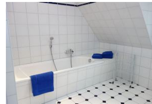
...und Badewanne !