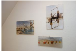
Bilder im Flur im OG