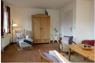
Die Leseecke und ein alter Bauerschrank für düd un dat.