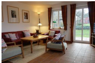
Das großzügige Wohnzimmer.