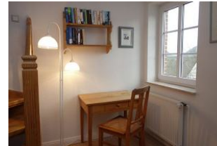
Ein kleiner Schreibplatz im Flur im OG für die ganz Fleißigen