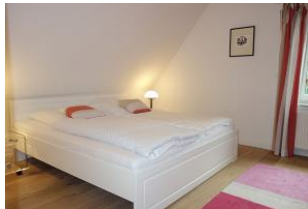
Grosses Bett im Elternschlafzimmer 180x200cm ohne Fussteil