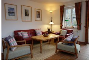
Couch und Sessel aus der Nähe.