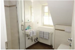
Das Bad mit Waschtisch, Dusche und Toilette