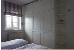
... und Einbauschränk, der alle Kofferinhalte aufnehmen kann.