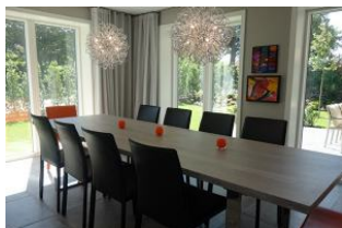
Hier noch einmal der Esstisch in seiner ganzen Größe, ideal zum essen, spielen, malen, schreiben usw.