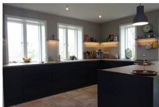
Die moderne Einbauküche....