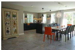
Der Blick in den Küchen/Essbereich