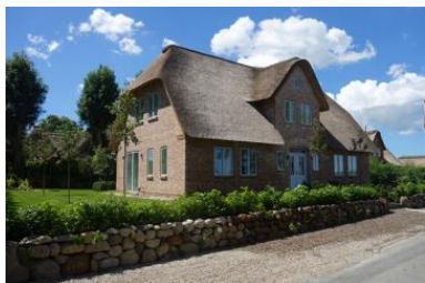
Das Krümels Hus in Wrixum direkt an der Marschkante gelegen.

Die Unterkunft verteilt sich über EG und 1.OG.