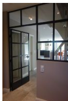
...treten Sie ein und lassen sich gefangen nehmen ....