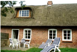
Die Terrasse mit gemütlichen Gartenmöbeln hinter dem Haus