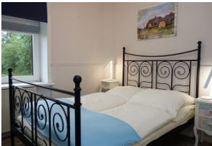
Ein Zimmer mit Doppelbett 160x200cm und ...