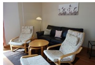
Das Wohnzimmer mit Couch und gemütlichen Sesseln.