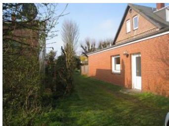
Die Eingangstür der Wohnung 5 der Ferienhäuser Carstensen