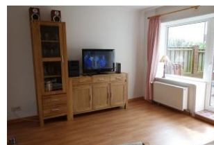
Grosses Fenster und Tür zur Terrasse