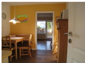
Ein Blick in die Küche mit Essplatz. Im Hintergrund das Wohnzimmer.