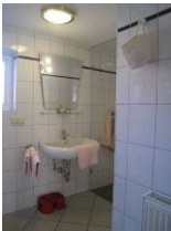
Das renovierte Bad mit ...