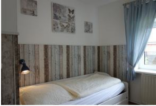
Ein Einzelzimmer mit ...