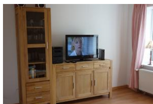
Die Technik darf natürlich auch nicht fehlen....