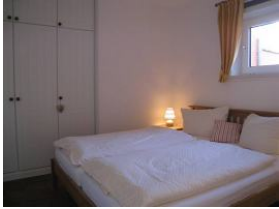
Das Schlafzimmer mit großem Doppelbett