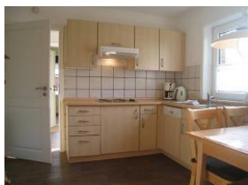
Die Einbauküche mit ...