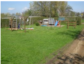
Der Spielplatz auf dem Grundstück, dahinter befindet sich der Parkplatz.