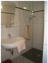
... einer Dusche ohne Wanne, Ecken und Kanten.