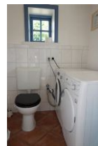
...und ein Extra-WC sowie Waschmaschine und Trockner zur kostenfreien Nutzung.