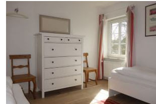
Kommode im Kinderzimmer