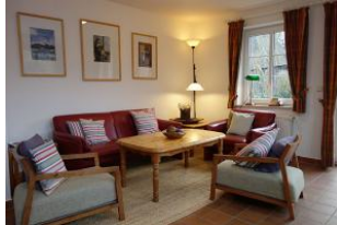
Couch und Sessel aus der Nähe.