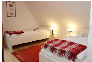
Zwei Einzelbetten im Kinderzimmer