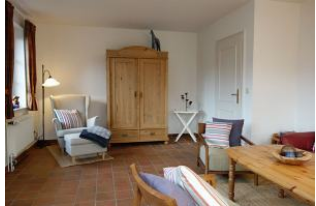
Die Lesecke und ein alter Bauerschrank für düd un dat.