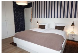
Das Doppelbett isst 180x200cm