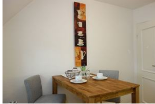
Der Essplatz in der sep. Küche für den Tee zwischendurch...