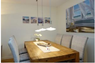
... Essplatz für 6 Personen...