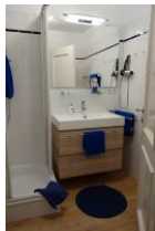
Modernes Bad mit Handwaschbecken und....