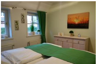
Sideboard für Kofferinhalte....