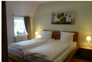
Ein Schlafzimmer mit Doppelbett 180x200 cm Verdunkelungsmöglichkeit.