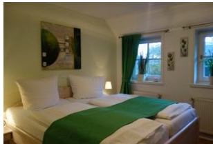
Das zweite Schlafzimmer mit Doppelbett, 180x200 cm Das Bett ist sehr hoch, verfügt unter dem Bett über Schubladen als zus. Stauraum. Verdunkelungsmöglichkeit