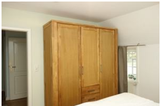
Der geräumige Kleiderschrank