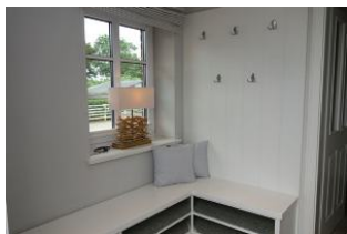
Der Eingangsbereich, Platz für Outdoorkleidung und Schuhe

Im idyllischen Ort Oevenum finden Sie das Doppelhaus Golfoase. Zwei großzügige Doppelhaushälften für je 6 Personen erwarten Sie. Ein gemütliches Wohnzimmer mit offener Küche und familientauglichem Essplatz, Austritt in den Garten und zur möblierten Terrasse, Sauna (mit Zusatzkostenverbunden). Ein großes Badezimmer mit Waschmaschine und Trockner. Im Obergeschoß die Schlafräume und ein weiteres Dusch+Wannenbad. Hier ist an alles gedacht, hier kann man sich wohlfühlen, hier... wird es Ihnen einfach nur gut gehen und das Beste.....Ihr Vierbeiner darf auch dabei sein.