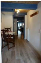
Der Flur mit großer Garderobe