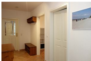
Treten Sie ein ....