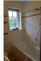
...Badewanne mit Duschmöglichkeit.. Nicht im Bild: der Wäschetrockner - kostenfrei zu nutzen