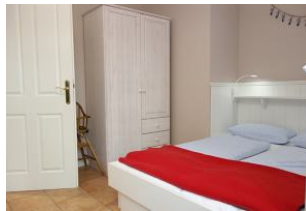
Auch dieses Schlafzimmer bietet einen Kleiderschrank