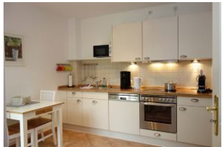
Ein zweiter Essplatz in der Küche und ein Teil der Küchenzeile.