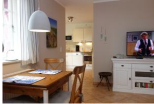
Der Durchgang zur Küche...