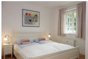
Das Elternschlafzimmer mit Doppelbett 180x200cm