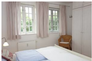
Der große Kleiderschrank hat viel Platz für die Kofferinhalte