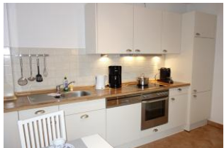
...der andere Teil der Küche.