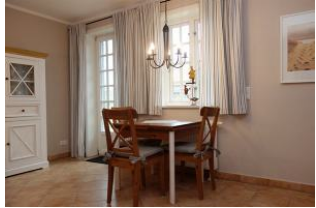
Der Esstisch aus der Nähe, ausziehbar.