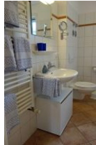
Das Bad mit Handwaschbecken, Handtuchheizung, Toilette....