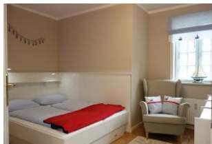
Das Kinderzimmer mit neuem Einbaubett 150x200cm gemütlichem Sessel und Fenster