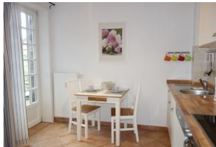
...der Essplatz, links der Austritt auf die Terrasse