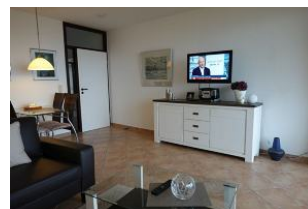
Das TV Gerät darf natürlich auch nicht fehlen...