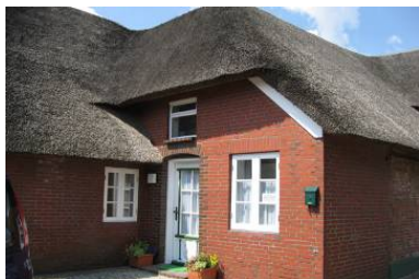
Die Eingangstür für die Wohnung 2 "Modern" des Hauses Welkimen tús