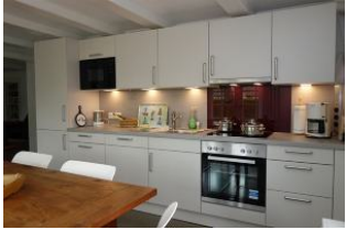
Die Einbauküche von der anderen Seite aus gesehen.