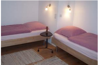
Das 2. Schlafzimmer mit 2 Einzelbetten