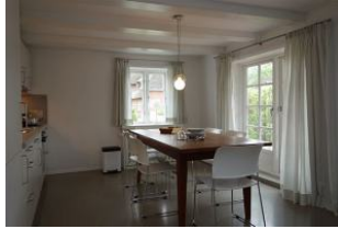
Der Tisch ist schon gedeckt ....