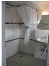
Das Duschbad mit Bodenabfluß