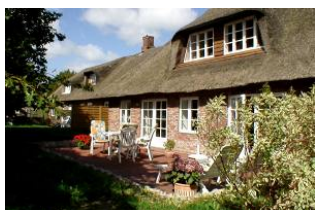
Die Terrasse mit dem wunderschönen Garten, eine Oase !

Der "moderne" Teil, die Wohnung 2 eines alten, friesischen Hauses, inmitten des alten Ortskern von Oldsum gelegen. Zum Einkaufen sind es nur ein paar Schritte. Der Utersumer Strand liegt ca. 4 km entfernt. Oldsum verfügt über mehrere Teestuben und Cafes sowie einem Gasthof. Alte Reetdachhäuser - so weit das Auge sehen kann. Idylle pur..... Sollten Sie mit Freunden anreisen wollen: das Bücherregal läßt sich wegschieben, so wird eine Verbindungstür zur Wohnung "Tradition" frei gegeben in der 4-5 Personen Platz finden.