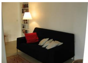
Hier noch einmal die Couch