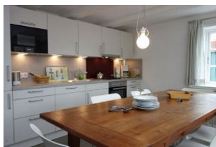
Die Einbauküche, im Vordergrund der große Esstisch