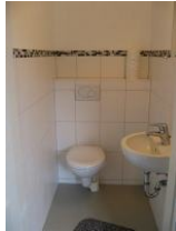
Das Gäste - WC